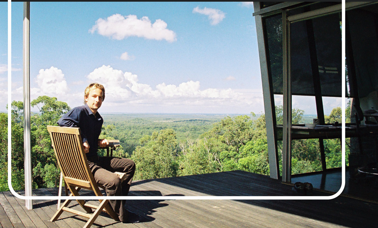
Very first employment as Architect, 2004, Sunshine Coast